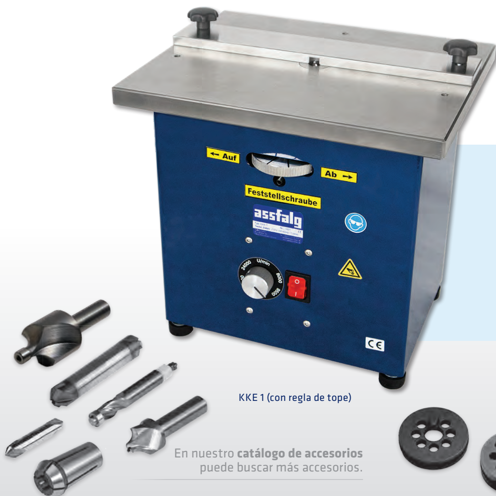
KKE 1 (con regla de tope)

En nuestro catálogo de accesorios puede buscar más accesorios.