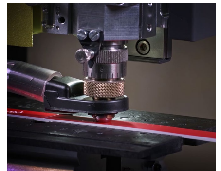
Placas de identificación y pequeña rotulación