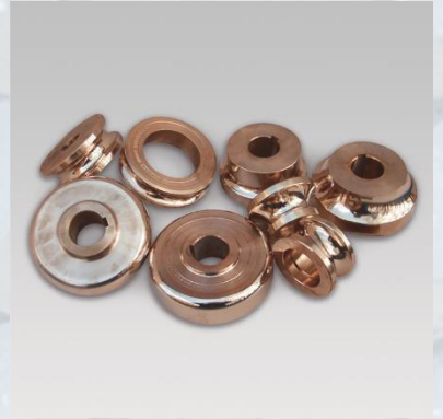
Rouleaux à mouler