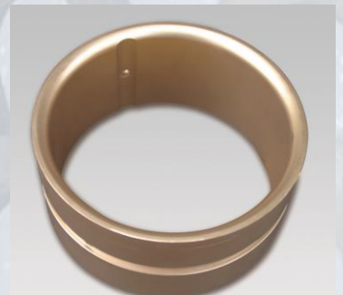
Coussinet hautes performances