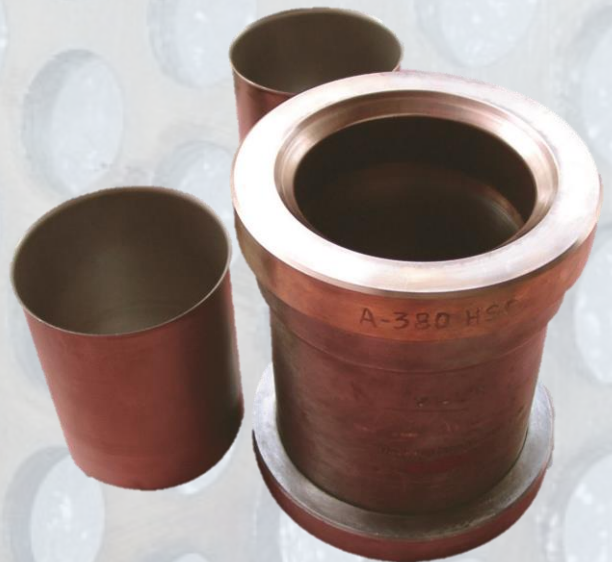
Forgeage de la matrice d'emboutissage