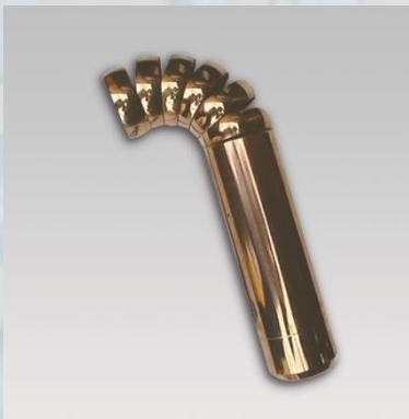
Mandrin de cintrage