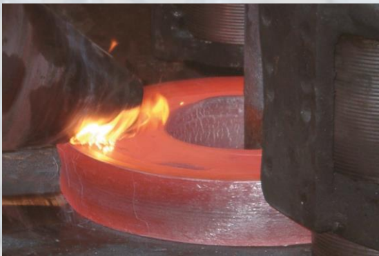
Forgeage de la matrice d'emboutissage