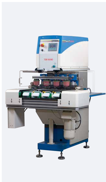
TSM 60/90 Kit multicolor Solo universal