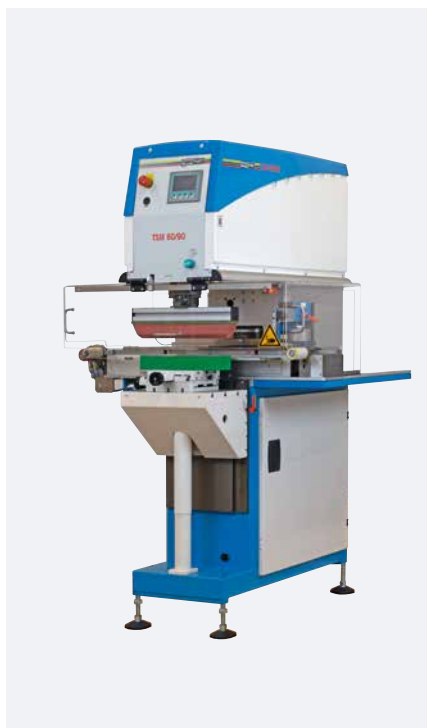
TSM 60/90 Kit de rascado transversal universal

Versiones con accionamiento servo mecánico se caracterizan por un alto número de ciclos y una gran fuerza de presión. Cinemáticas de eficiencia energética en el movimiento del rascado o del tampón y una construcción del bastidor de la máquina en modo ahorro de recursos redondean el concepto de máquina de éxito.