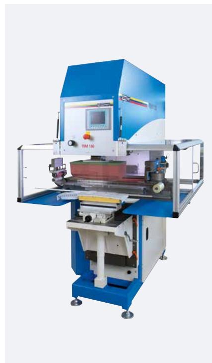
TSM 130 Kit de rascado transversal universal