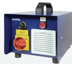
Unidad de control FU 2.2

Son las fresadoras de cantos manuales más robustas y potentes para trabajos pesados. Con la tecnología del volante de inercia con resorte, los grandes chaflanes se pueden fresar de forma más fácil, segura y económica.