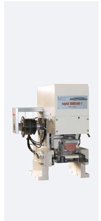
RAPID 3000/60-1 Modelo integrado para automatizaciones, accionamiento externo