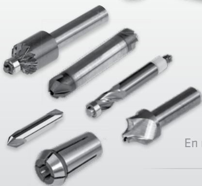
ASO 600-ASL con regleta de tope

En nuestro catálogo de accesorios puede buscar más accesorios.