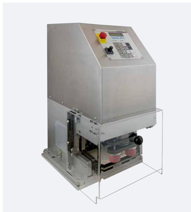
SPEED 40-2 cubierta de la caja de acero inoxidable