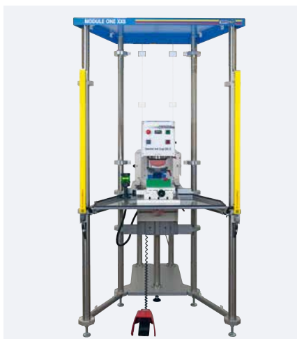
MODULE ONE XXS con máquina de tampografía SEALED INK CUP 90 E

El MODULE ONE XXS consta básicamente de un bastidor compacto, una carcasa protectora, así como los tres componentes estandarizados: barrera de luz, mesa angular y soporte en cruz.