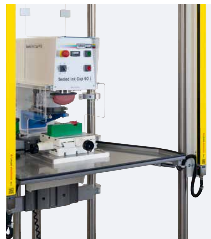
Mesa angular con bandeja

La mesa angular de altura regulable permite imprimir piezas de distintas alturas.