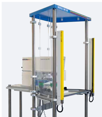
Barrera de luz

La máquina de tampografía se configura de manera individual a partir de las series HERMETIC, SEALED INK CUP E y V-DUO.