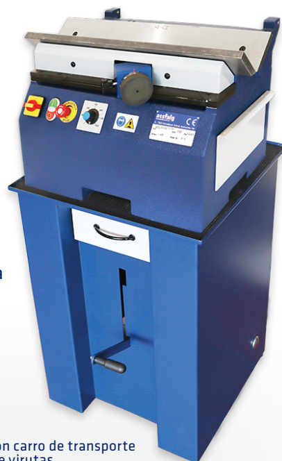
ASO 850-K con carro de transporte y recogedor de virutas.

La biseladora estable y sencilla ha sido diseñada para desbarbar y biselar piezas pequeñas y medianas con un grosor superior a 2 mm. Con la interacción óptima del cabezal de corte y las plaquitas de corte reversibles la máquina consigue chaflanes sin vibraciones, limpias y constantes de hasta 3 mm x 45° en un corte.