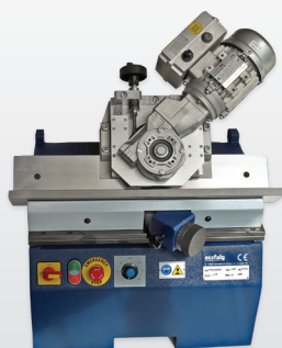
ASO 850-K con avance automático.