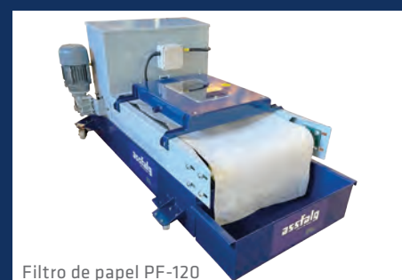
Filtro de papel PF-120