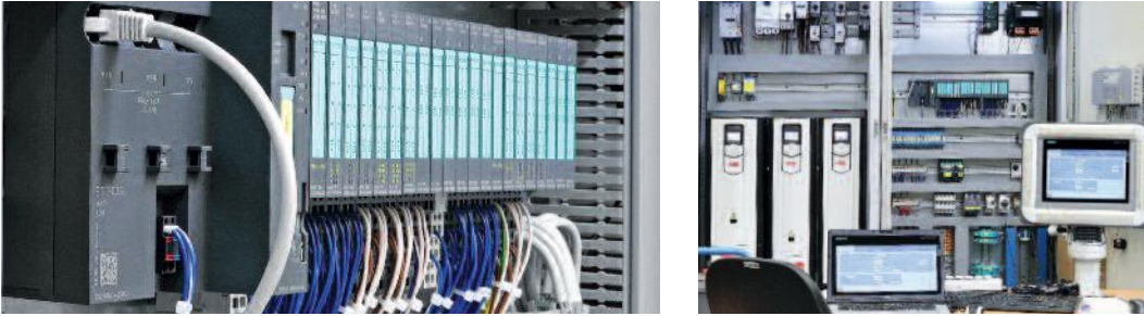
Soluciones adaptadas individualmente se verifican en nuestro centro de pruebas.