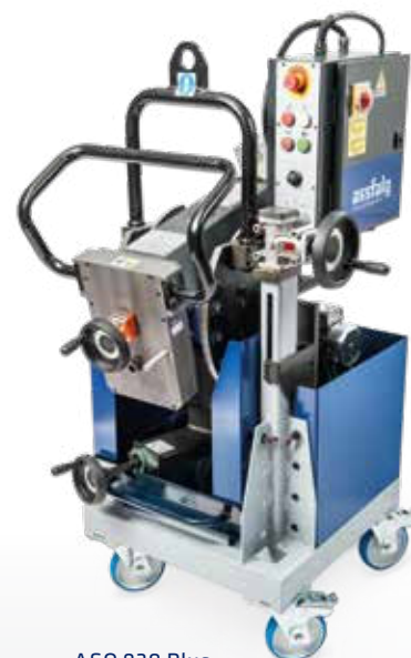
ASO 930 Plus