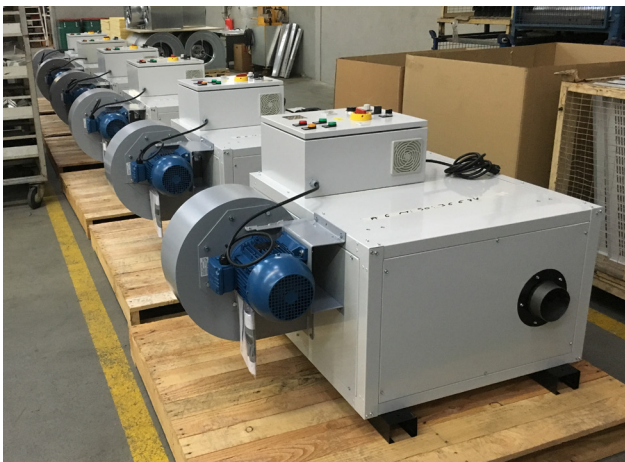
AGM con ventilador de media presión AGM with medium pressure fan AGM avec ventilateur moyenne pression

NUESTROS EQUIPOS CUMPLEN CON EL REGLAMENTO (UE) 2016/426 CORRESPONDIENTE A EQUIPOS QUE FUNCIONAN CON COMBUSTIBLES GASEOSOS Y REGLAMENTO (UE) 2016/2281 CORRESPONDIENTE AL DISEÑO ECOLÓGICO