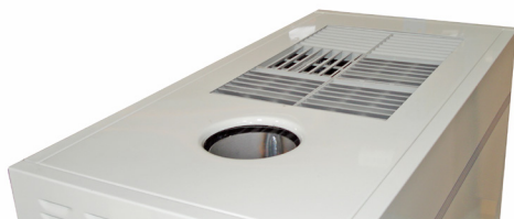
Rejilla de aire multidireccional Multidirection air grid/multidireccional Grille d'air multidirectionnel