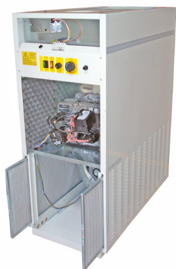
Quemador insonorizado. Filtro de admisión de aire. Sound insulated burner. Air inlet filter. Brûleur insonorisée. Filtre d'admission d'air.